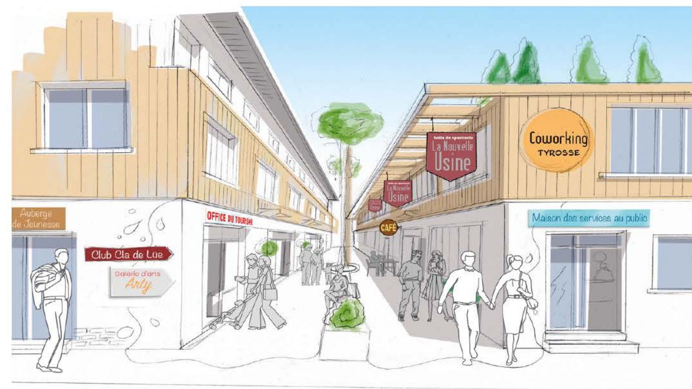
Le monde d'après ...

Le projet Adidas c'est une place pour chacun (locaux pour les associations, salle Cla de Lue, pôle et auberge de jeunesse, espace de coworking, magasin éphémère) et du lien entre tous (salle de spectacle, médiathèque, maison de service au public, fablab, office du tourisme). C'est ça, aussi, le monde d'après.